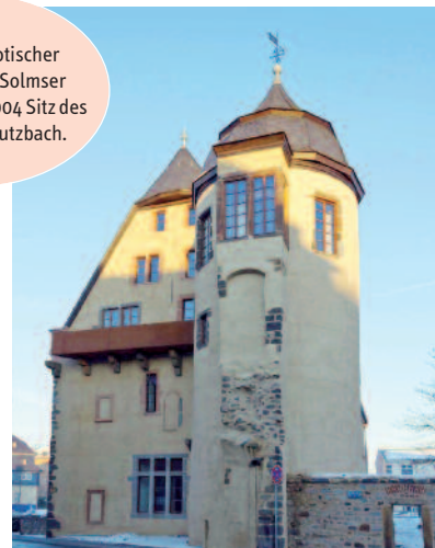
Abb. 3: Im Kern spätgotischer Steinbau – das Solmser Schloss war bis 2004 Sitz des Amtsgerichts Butzbach.

Das Raumprogramm der Zahnärzte und die funktionalen Zusammenhänge waren von Beginn an klar definiert. Das räumliche Konzept